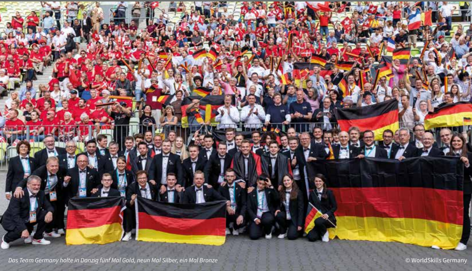
Das Team Germany holte in Danzig fünf Mal Gold, neun Mal Silber, ein Mal Bronze